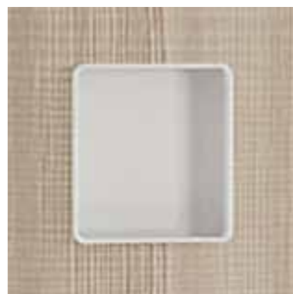
MQ1 . MQ2 . MQ3