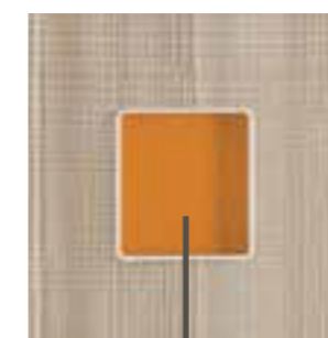
ESEMPIO FONDALE ARANCIO