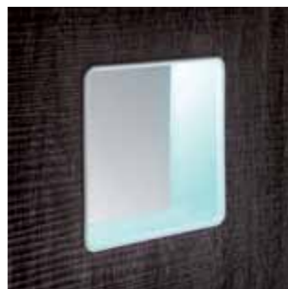
MQ5 . MQ6 . MQ7

EMBEDDED WITH LIGHT ENCAJE CON ILUMINACION ENCASTRÉE AVEC ECLAIRAGE