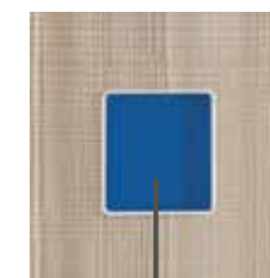
ESEMPIO FONDALE BLU